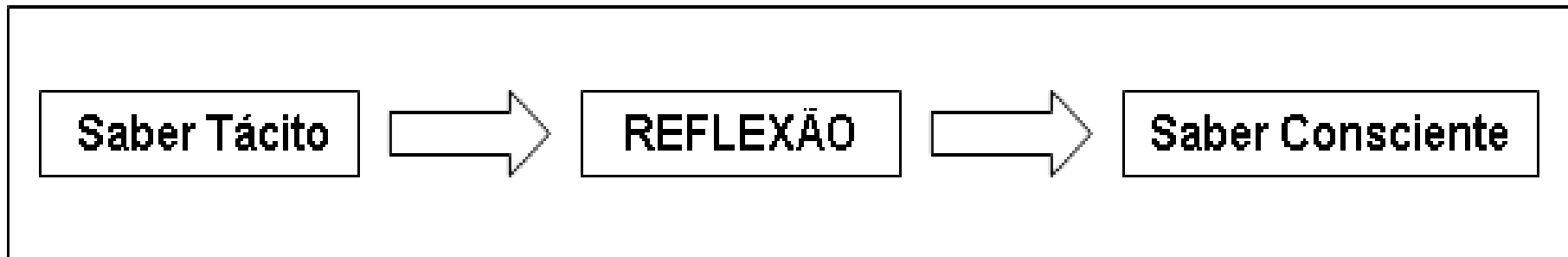
Figura 1 – Saber Docente

o conhecimento da prática exige O saber tácito pode transformar-se num saber consciente , segundo o seguinte esquema: