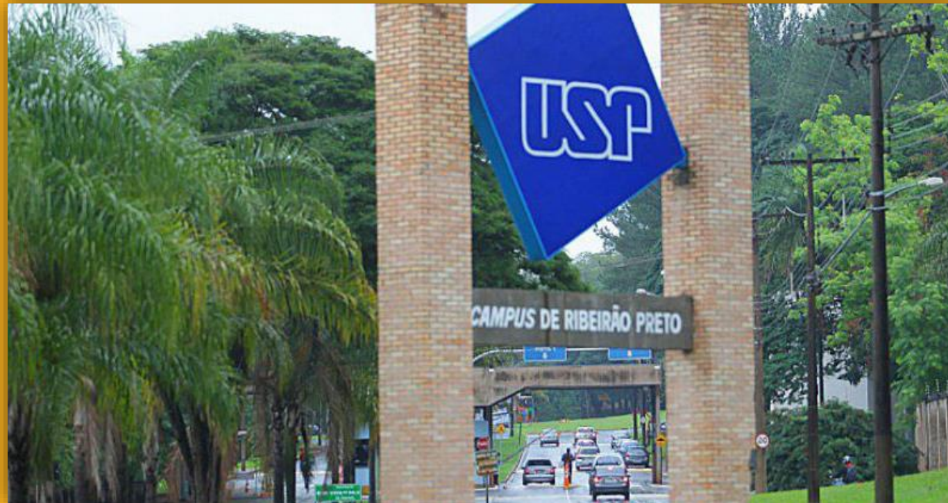
Entrada do Campus da USP em Ribeirão Preto